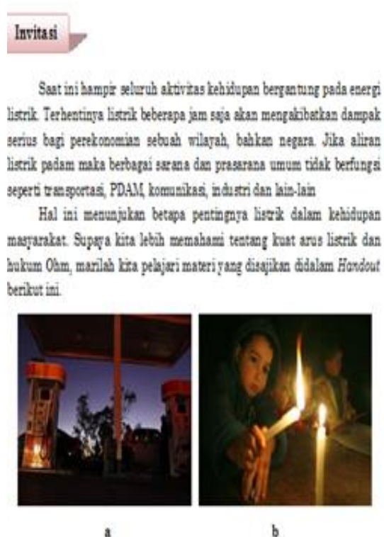
Gambar 2. Salah satu contoh komponen invitasi

Pada tahap Prototype Stage ini terdiri dari 3 kegiatan ( prototype 1 , prototype 2 dan prototype 3 )