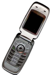
Gambar 2. Contoh gambar dengan resolusi cukup