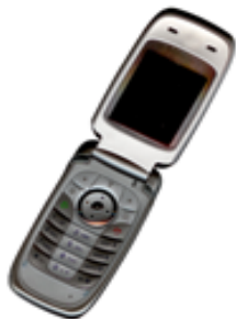
Gambar 1. Contoh gambar dengan resolusi kurang

Simbol diketik dengan huruf miring (T mengacu pada suhu, tetapi T merupakan satuan Tesla). Mengacu pada “(1)”, bukan “Pers. (1)” atau “persamaan (1)”, kecuali pada awal kalimat: “Persamaan (1) merupakan ...”.